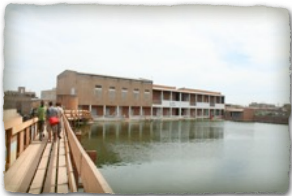
Fotografia: Edifici del col·legi de secundària del barri de Thiaroye de Pikine suburbi a la ciutat de Dakar