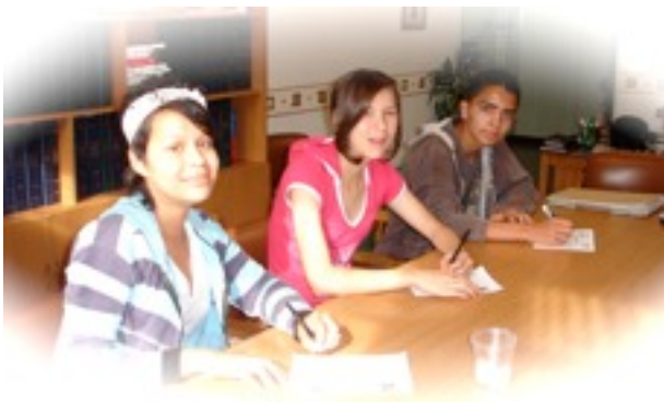
Fotografia: Tres becaris en la biblioteca del col·legi de Medellín.

Aquests adolescents són tres d'un total de nou becaris que la nostra ONG Gra d'Arròs els hi subvenciona els estudis i manutenció a Medellín fins a concloure la carrera universitària escollida. La nostra associació vetlla mensualment per la marxa d'aquests estudiants. La nostra contrapart, sempre ens facilita les dades de disposició i aptitud de cada estudiant i les notes que trimestralment obtenen com les de tancament de curs.